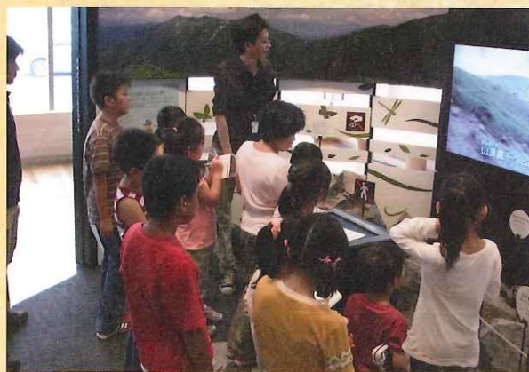
■栃木県子ども観光大使レクチャー風景

来場者のほとんどが家族連れや親子、カップルで、いろんな葉っぱに触れたり、モミヤリヨウブの香りを嗅いだり体験型のPRを行ったことで自然に興味や関心をもっていただき、那須高原に来て下さるきっかけづくりになったかなと思っています。今後も地域のイベント等に参加し、那須高原ビジターセンターや那須平成の森のPRはもちろん、那須子地域を紹介していきたいです。(ひーぼー)