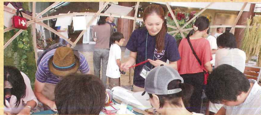
■葉っぱのしおりづくり

レクチャールームは99名、会議室は36名で利用可能です。利用に関しては那須高原ビジターセンターまでお気軽にお問い合わせください。(みや)