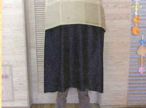
■「NASU ONE DAY MARKET」でも紹介 ビジターセンターでは設置型で体験できます!!

「あれはなに？」とお台場のイベント会場で、すれ違う人が一度は立ち止まったこの物体。外見は半球状のダンボール素材にガムテープで固定された粗末なつくり。しかし、この中に入ったら別世界。美しいきらめきが頭上に広がります。