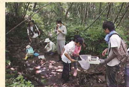
■「水辺をめぐる冒険」