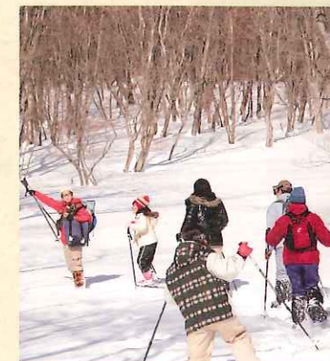
■スノーシューガイドウォーク