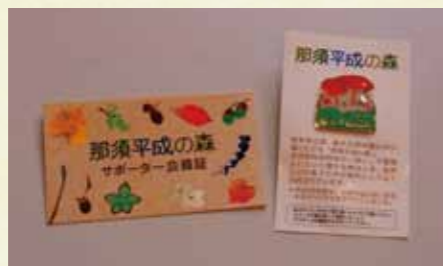
平成29年度ピンバッジは「タマゴタケ」のデザインです

平成29年度も那須平成の森基金の活動にご理解、ご支援を賜りますようお願い申し上げます。